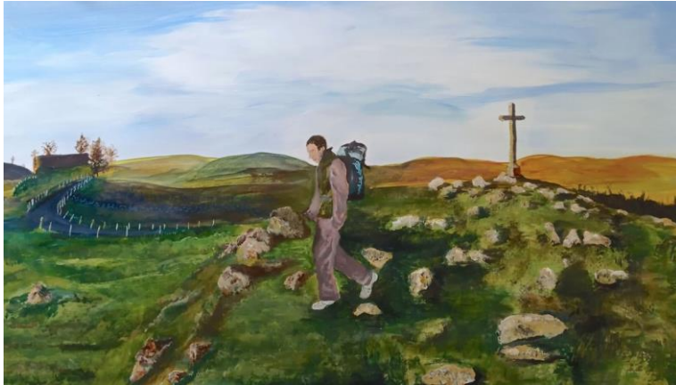
A la croisée des chemins - Chambles (T. Brun)