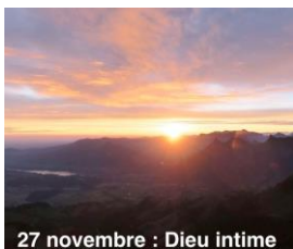
27 novembre : Dieu intime